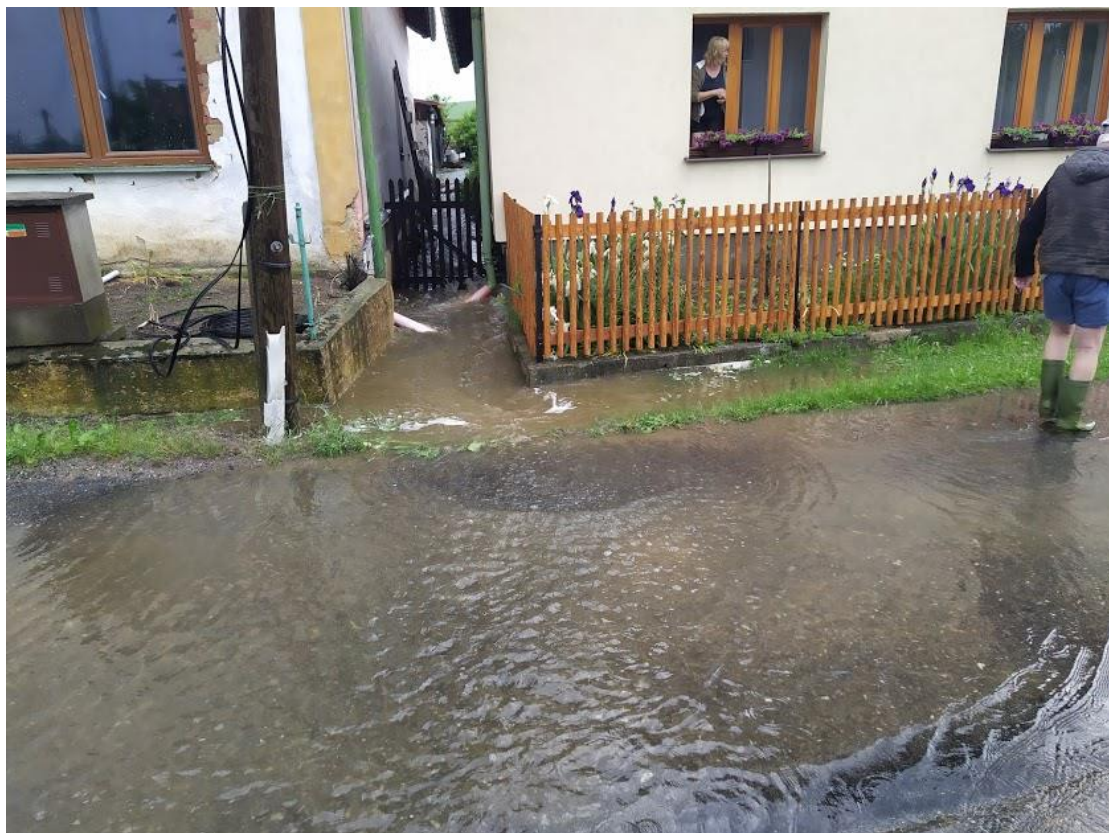
Voda také stékala z polí a luk a natekla obyvatelům obce do sklepů.