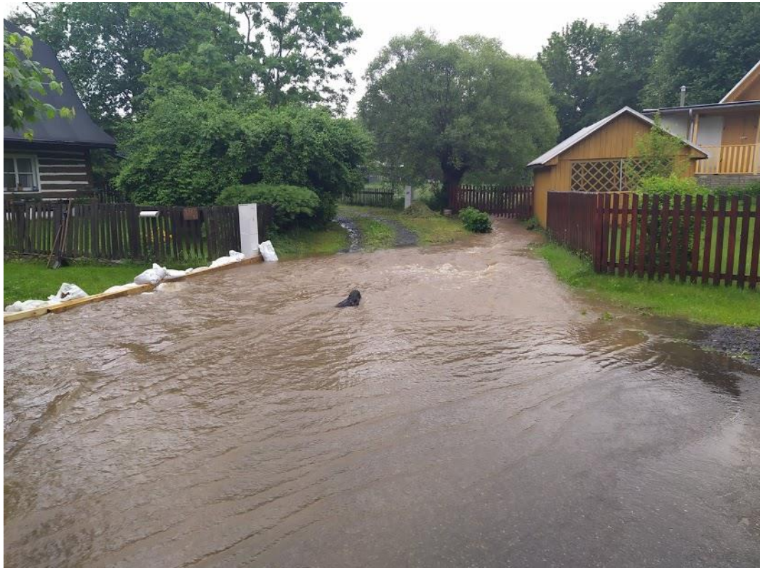
Následky rozvodněného malého potůčku u domu čp. 134 ; čp. 44 a čp. 117.