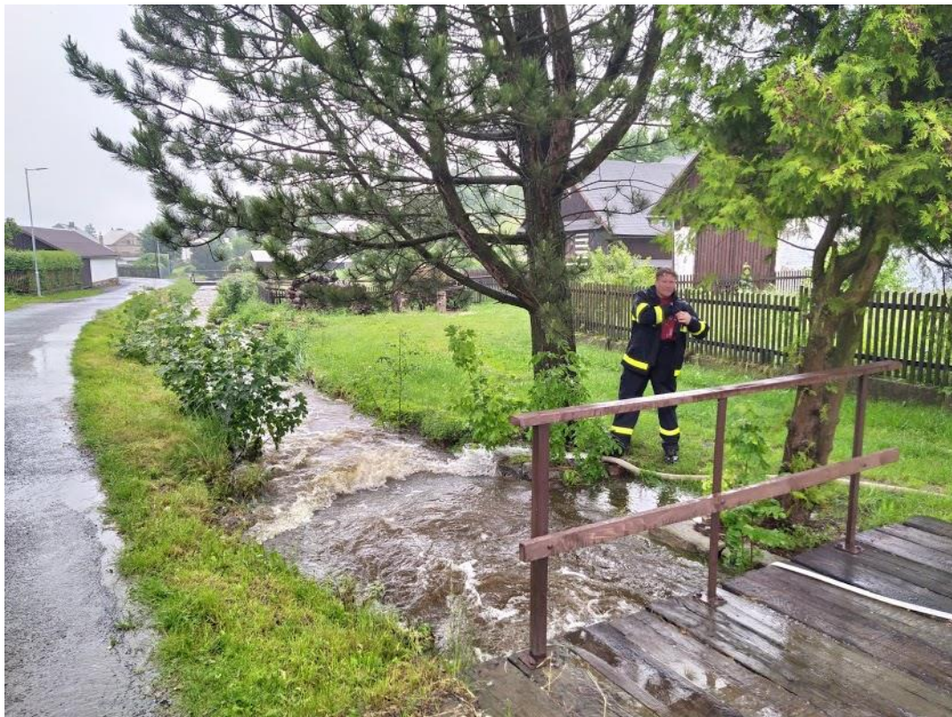
Jednotka požární ochrany obce Pustá Kamenice čerpala vodu ze zatopených sklepů občanů naší obce.