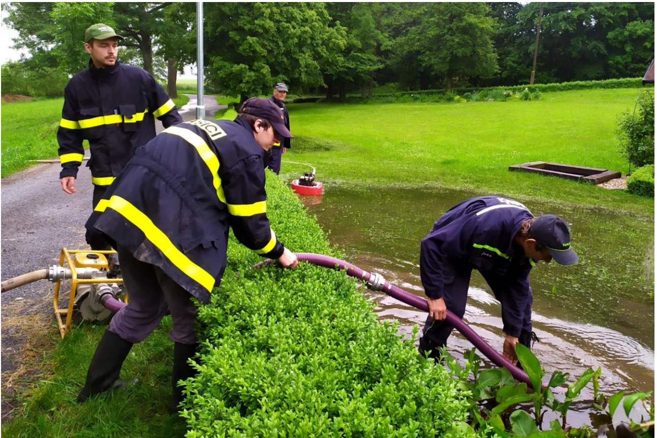
Čerpání vody u čp. 22 v neděli po vydatných deštích.